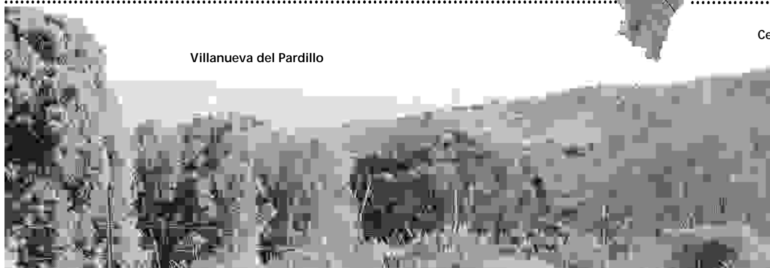
Villanueva del Pardillo