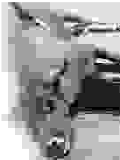
Algunos asistentes a las corridas de este verano, buenos aficionados a los toros, han calificado los festejos como "carnicería".

Lo peor de los toros -con ser malo- no es que muera un animal con refinada crueldad (y en ocasiones incluso un ser humano). Lo peor es la exaltación que se hace de la violencia y la brutalidad, aún